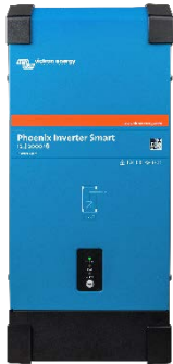
Invertor Phoenix Smart 12/2000