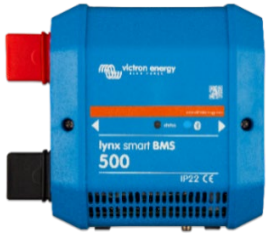
Lynx Smart BMS 500 A