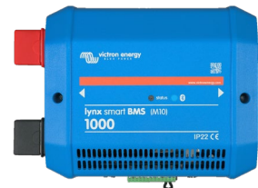
Lynx Smart BMS 1000A