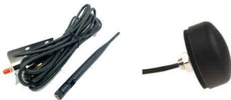
Antenă de perete LTE-M pentru exterior opțională (ANT100200100)