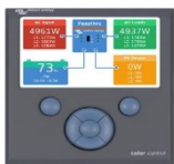
Panou de control Color GX