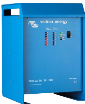
Skylla TG 24 100