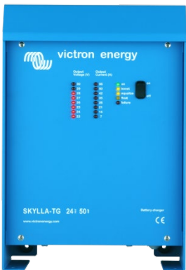
Skylla TG 24 50