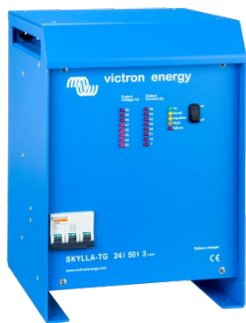
Skylla TG 24 50 3 phase

Pentru a afla mai multe despre baterii si incarcarea bateriilor, va rugam sa consultati cartea noastra 'Energy Unlimited' ('Energie Nelimitata') (disponibila gratuit pe site-ul www.victronenergy.com ).