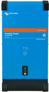
Inverter Smart 12/3000