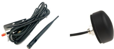
Antenă de perete LTE-M pentru exterior opțională (ANT100200100)